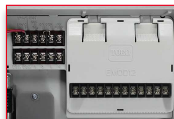
Konfigurace 16 stanic s jedním modulem pro 12 stanic