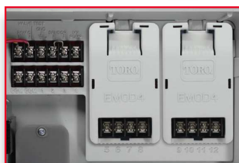
Konfigurace 12 stanic se dvěma moduly pro 4 stanice